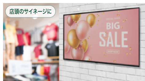
店頭のサイネージに