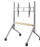
朝日木材加工株式会社 PS-HIT11 ディスプレイスタンド